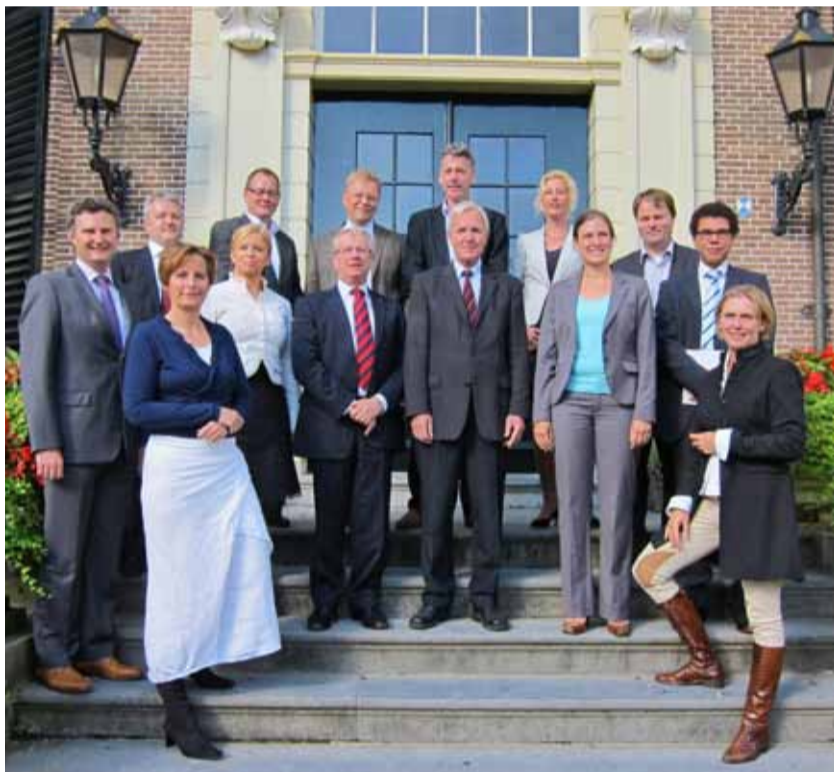
Het Platform Duurzame Huisvesting met Jan Terlouw eind augustus 2010 voor Kasteel Groeneveld.