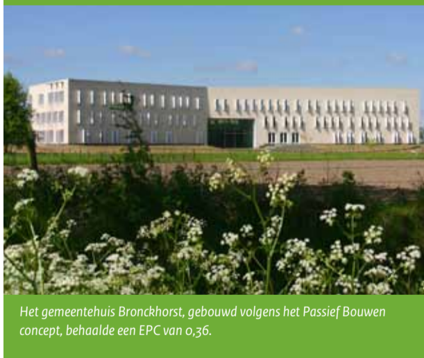
Het gemeentehuis Bronckhorst, gebouwd volgens het Passief Bouwen concept, behaalde een EPC van 0,36.