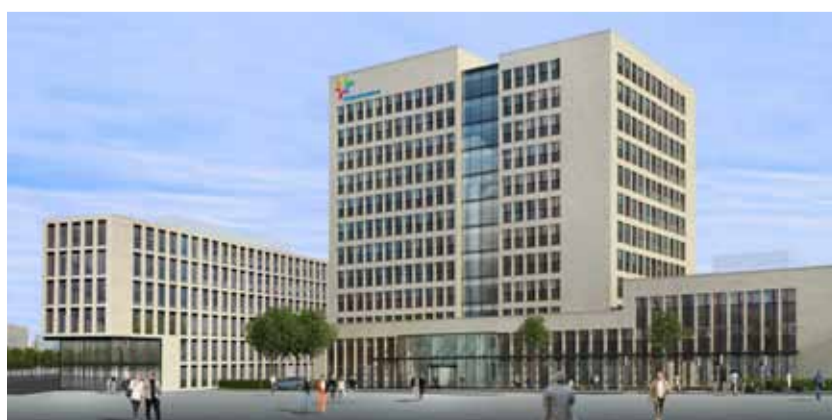
SPF Beheer heeft het gebouw van FrieslandCampina in Amersfoort verduurzaamd van label G tot A+.

SPF Beheer beheert ruim 1,3 miljard aan vastgoed van twee pensioenfondsen, SPF en SPOV. Momenteel wordt onderzocht hoe het vastgoed verder kan worden verduurzaamd. Robijn: "Niet alleen uit principe, maar ook omdat het goed is voor het rendement en het risico van de vastgoedbeleggingen van SPF en SPOV. Centrale vragen bij het verduurzamen van vastgoed zijn: hoeveel moet ik investeren en krijg ik hier een goed rendement in de vorm van huur en waarde voor terug?" Een goed voorbeeld is de renovatie van het kantoorgebouw van FrieslandCampina. "FrieslandCampina was bereid om mee te betalen aan de verduurzaming van het pand. SPF investeerde in een WKO waardoor FrieslandCampina nu € 200.000 aan gas per jaar bespaart. Daarvoor betalen ze € 100.000 extra huur. De huurder bespaart dus nog steeds € 100.000 per jaar en wij realiseren een goed rendement voor SPF. En het Energielabel maakt een sprong van G naar A+."